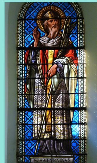
Baie du chœur à médaillons et saint Saturnin.

Le saviez-vous Une ancienne porte d'accès servant avant l'agrandissement est toujours visible à l'extérieur de l'église.