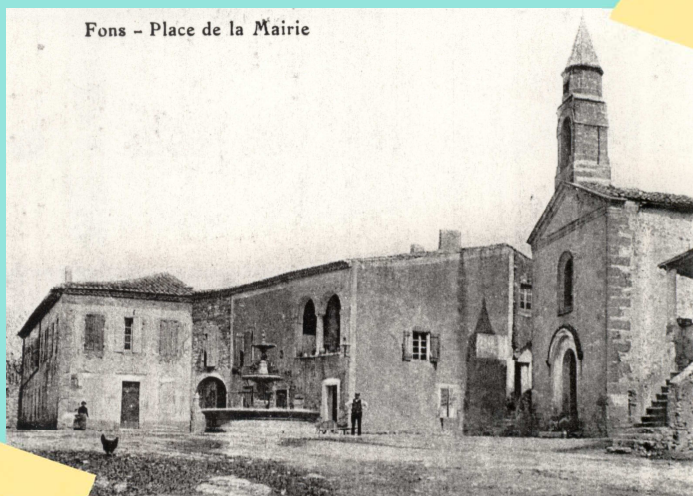
Vue ancienne de la place Alphonse Daudet de Fons.

L'agrandissement est inauguré le 8 septembre 1850 par l'évêque Jean-François-Marie Cart.